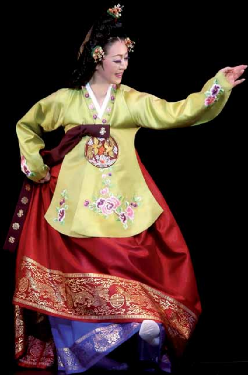
Exposition « Souffle coréen » par Song In-ho.