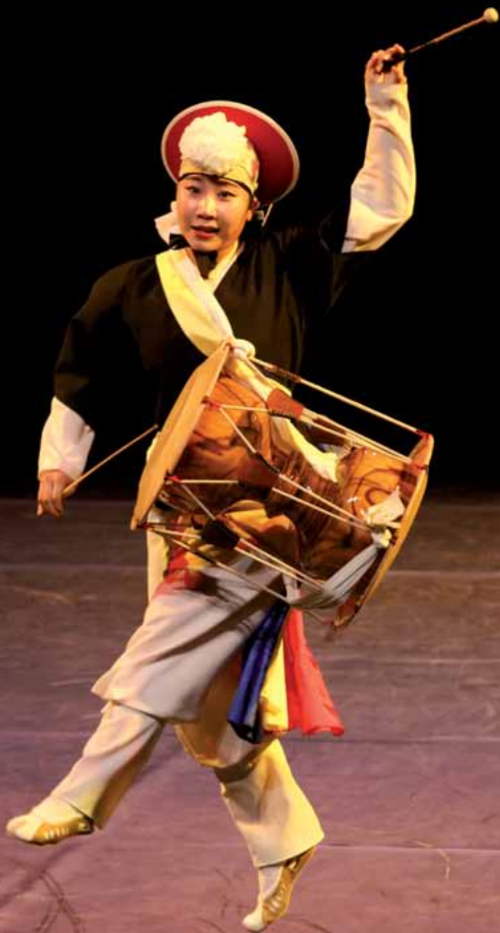
"Rythmes de Corée" par la troupe Samulnori NoNi